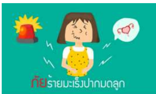
ภาพที่ 4 ฉากที่แสดงให้เห็นถึงภัยร้ายจากมะเร็งปากมดลูก

5.2 ผลการศึกษาความพึงพอใจของผู้ที่ได้รับชมสื่อโมชันกราฟิกเรื่องภัยร้ายมะเร็งปากมดลูกในกลุ่มสตรี เมื่อหลังจากเปิดสื่อโมชันกราฟิกให้ความรู้ในกลุ่มสตรีเพื่อป้องกันภัยร้ายจากโรคมะเร็งปากมดลูกให้ผู้ชมที่เป็นผู้หญิงที่เป็นกลุ่มตัวอย่างจำนวน 351 คน ในตำบลหนองปากโลง อ.เมือง จ.นครปฐม สรุปผลได้ดังตารางที่ 1