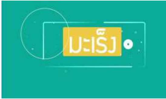
ภาพที่ 2 ฉากแรกของสื่อโมชันกราฟิกให้ความรู้ในกลุ่มสตรีเพื่อป้องกันภัยร้ายจากโรคมะเร็งปากมดลูก

5.1 ผลการพัฒนาสื่อ เมื่อเปิดสื่อโมชันกราฟิกให้ความรู้ในกลุ่มสตรีเพื่อป้องกันภัยร้ายจากโรคมะเร็งปากมดลูก ผู้ชมจะเห็นชื่อเรื่องในส่วนแรกเป็นการเกริ่นก่อนเข้าเนื้อหา ดังภาพที่ 2